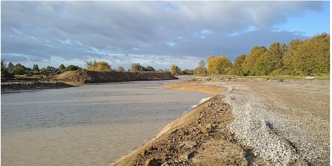
Foto im Bau - Umschluss Teilabschnitt 6